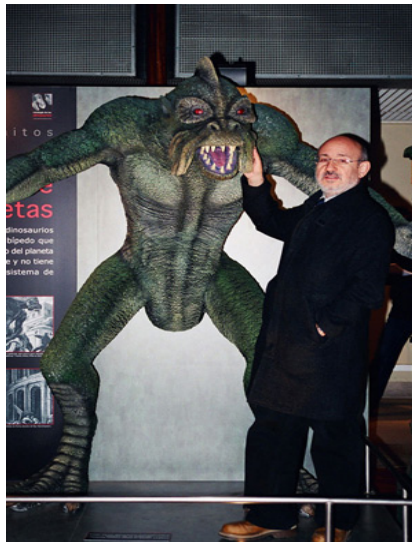
Fig.3.- Recreación del dinosaurio extraterrestre (venusino) de la película "Twenty Million Miles to Earth" (1957), con el autor de este artículo. Escultura de Javier Hernández para la exposición "Mitología de los dinosaurios". Cortesía del Museo Nacional de Ciencias Naturales de Madrid.

que se encuentran en el límite entre la realidad y la leyenda, como a la "Gran serpiente de mar" o el famoso "Yeti".